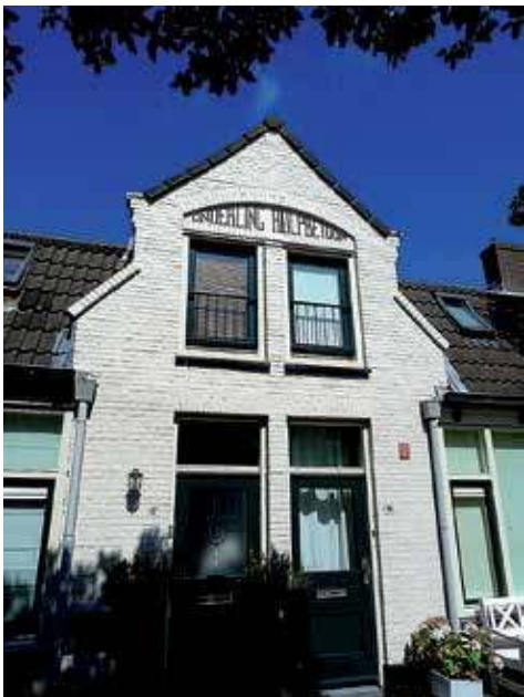
'Onderling Hulpbetoon' Kanaalweg nr. 17

12 Blijf aan deze kant van de Haltestraat lopen en ga vervolgens linksaf bij café Fier de Koningstraat in. Halverwege de Koningstraat staan de huizen van Onderling Hulpbetoon met op nummer 14 de eerste steen in de muur. In de gevel staat de naam van Onderling Hulpbetoon.