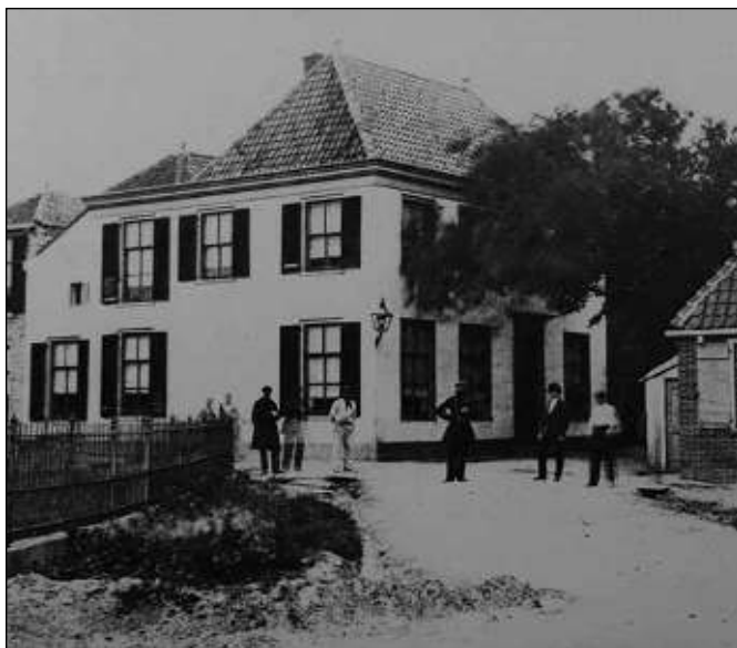
'Kids Avenue' toen het nog een dokterspraktijk was

een van de oudste bouwwerken van Zandvoort en is een Rijksmonument. Als de kerkdeur open staat, ga dan beslist voor een bezichtiging naar binnen.