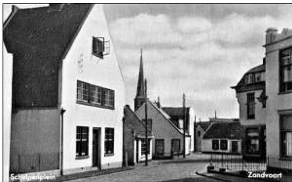
Boven: Colpitt, nu brandweerkazerne