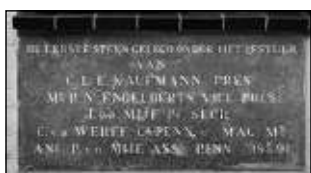
Onder: Eerste steen Witte Kruis