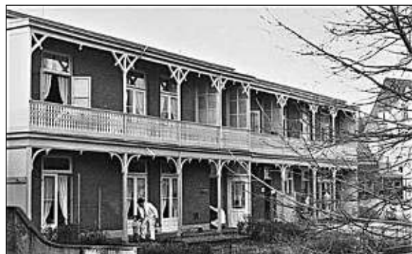
Hierboven: de veranda's aan de Poststraat