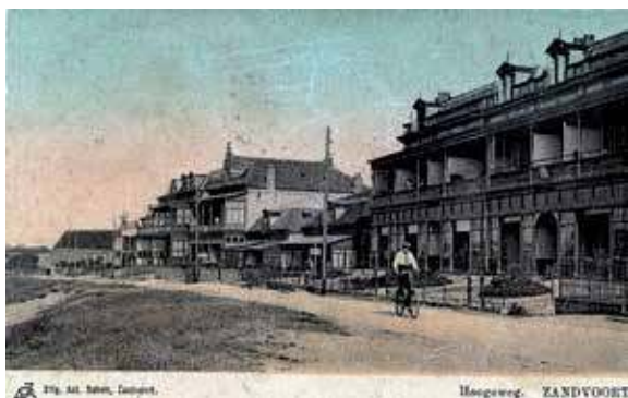
Boven: de hoek van de Poststraat en de Hogeweg ca. 1883

Aan de rechterkant staat de oude brandweerkazerne die nog steeds gebruikt wordt. Vanaf 1956 was in dit gebouw Colpitt technische