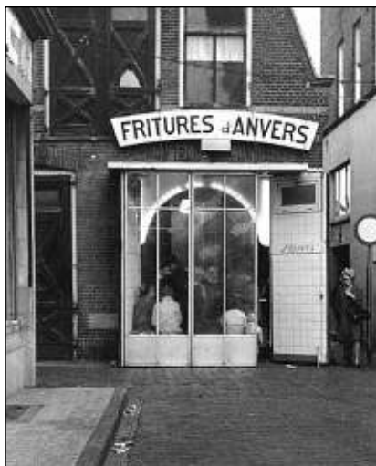
Rechts: Fritures d'Anvers