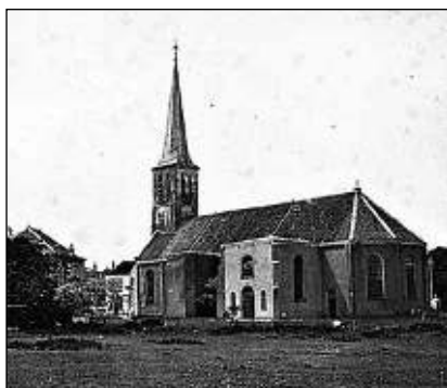
Rechts: Protestante kerk ca. 1900