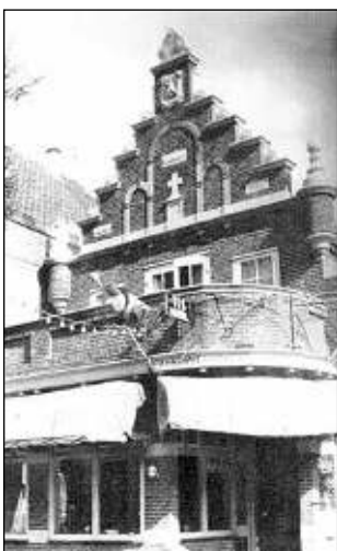
Boven: Voormalig Café Neuf

17 Steek de straat over en ga bij de buitenkastjes van het Raadhuis, via de fraaie houten deur, het Raadhuis (1911) in. Deze houten deur met symbolisch houtsnijwerk was vroeger de ingang van het politiebureau.