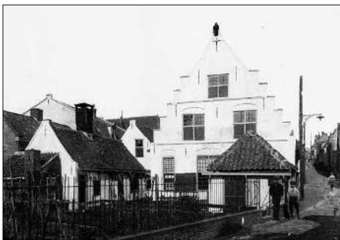
Geheel onder: De kastanje voor café 'Het Wapen van Zandvoort'

Het Gasthuisplein is vernoemd naar het Oude Mannen- en Vrouwengasthuis dat op het plein vanaf 1583 stond en in 1929 werd afgebroken. Het was voorzien van een prachtige trapgevel met op de top een beeldje van een visserman. Dat topbeeld is nog aanwezig in het Zandvoorts Museum. Alleen de kastanjeboom uit 1890 die in de tuin van het Gasthuis stond, is bewaard gebleven en is een gemeentelijk monument!