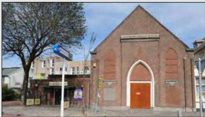
Theater De Krocht.

In 1824 wordt het arme vissersdorp Zandvoort 'ontdekt'. Het dorp trekt vele badgasten. Uit het hele land maar ook daarbuiten. Deze zomerwoningers, waaronder zeker ook katholieken, willen hun godsdienstplichten kunnen vervullen. De tijd van de schuilkerken is voorbij. Hier en daar verrijzen nieuwe kerkgebouwen. Op 3 Maart 1854 gaat de eerste spade de grond in voor de St. Agathakerk. Op 18 April wordt de gedenksteen gelegd die nog steeds aanwezig is aan de linkerkant van Theater De Krocht. Door de steenkapper Toepoel laat de pastoor l'Ami boven de ingang van de kerk de woorden inkappen: Sanctuarium meum metuite, hetgeen vertaald betekent 'Hebt eerbied voor mijn heiligdom'. De tekst is nog te zien boven de ingang van het gebouw De Krocht.