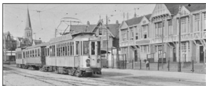
Toen nog de Tramstraat.