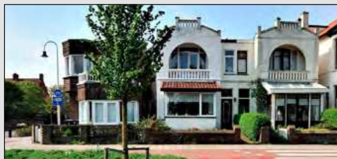
Villa Salve en Johanna 2010.