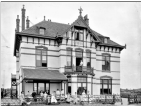
Vakantiekolonie Frisia later kinderpensioen Groot Kijkduin.

13 U loopt nog steeds aan de linkerkant van de Kostverlorenstraat, ga naar de eerste straat links de Julianaweg en sla deze weg in. Op de hoek staat een monumentaal pand. Het was ook een vakantiekolonie genaamd Villa Frisia.