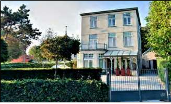
De Berk (nr. 102).