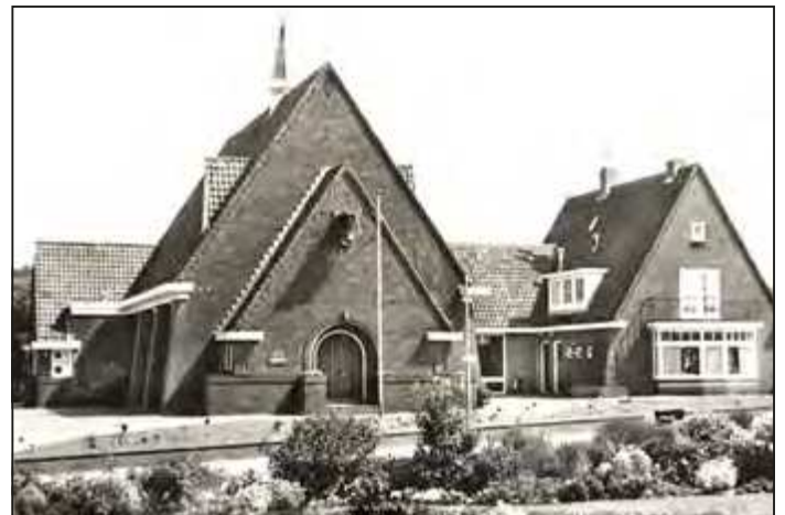
De voormalige gereformeerde kerk.