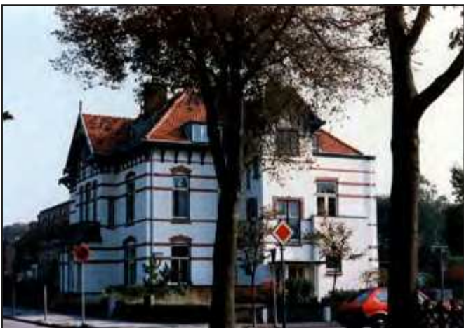
Het pand is nu in woningen onderverdeeld en er is een dokterspraktijk in gevestigd.

14 Loop de Julianaweg in en ga vervolgens naar de eerste straat rechts; de Emmaweg. Schuin op de hoek Julianaweg/Emmaweg staat een Gereformeerd kerkgebouw. Dit kerkje heeft nu de functie van wonen en er zijn appartementen in gevestigd.