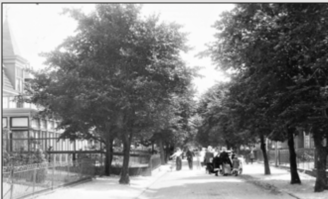
Haarlemmerstraat werd bestraat.