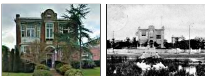
Het huis met de vijver.