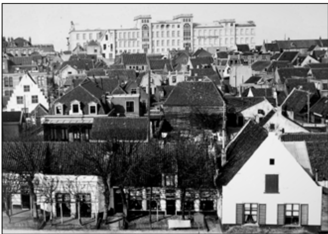
Aan de voorzijde bij de Swaluestraat lag de boerderij Saase.