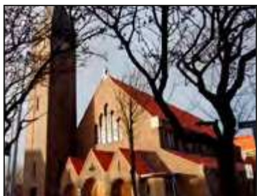
De tweede St. Agathakerk.