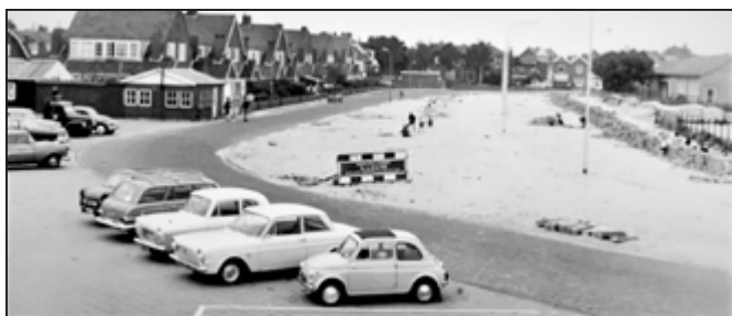
Het Zwarte Veld.