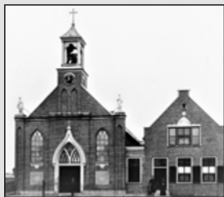
St Agatha Kerk.