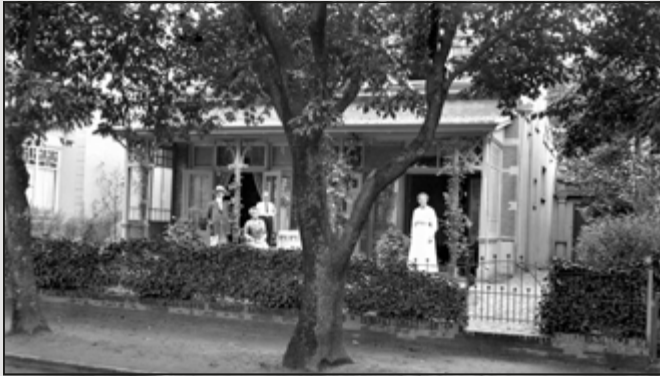
De Haarlemmerstraat heeft veel woningen met veranda's.