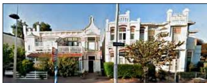
nr. 33 Villa Lands End.

Het Zandvoorts Museum is het startpunt van de wandelroute