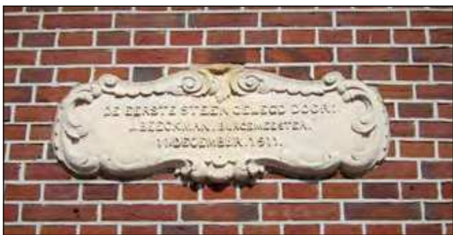
De gevelsteen van het oude raadhuis.