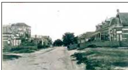
Haarlemmerstraat als zandpad.