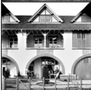
De Grote Krocht.