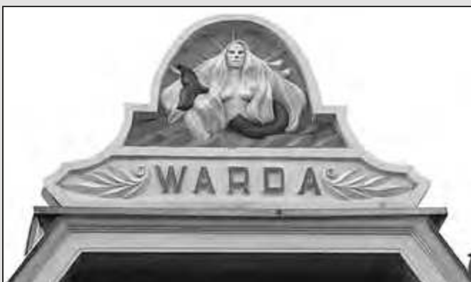
Warda is een Germaanse naam en staat voor hoeder of bewaarder.