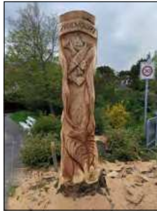
Boom als kunstwerk.

In de Kostverlorenstraat staan villa's met op de gevel bomennamen het zijn de nummers 100, 102, 115, 117.